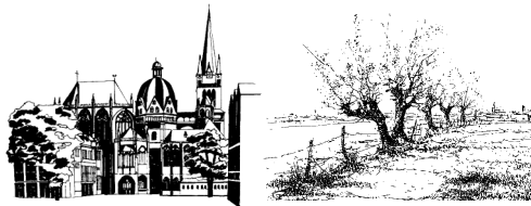
Begegnungsstätte Christus König